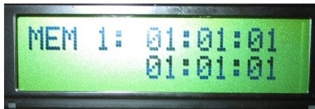
Obr.3. Menu 3

tlačítka KEY4 (MEM) je možné vyvolať menu 3. Pozri obr.3. Na displeji sa zobrazuje číslo pamäťového miesta a časy ktoré sú na tomto mieste uložené. Tlačítkami plus a mínus sa posúva číslo pamäťového miesta, medzi hodnotou 0 až 9. Stlačením KEY1 (OK) sa nastavená hodnota prenesie do čítačov času. Stlačením ESC sa vykoná návrat z menu 3 do menu 1, bez ovplyvnenia aktuálne nastaveného času. Podržaním tlačítka KEY2 v menu 1 sa prejde opäť na menu 3 ale v režime ukladania do pamäti. Na displeji je text ako na obr.3. Zobrazovaný je čas ktorý sa bude ukladať do pamäti.