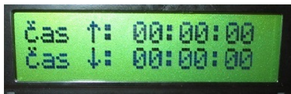
Obr.1. Základné menu

Najprv popíšem ovládanie časovača. Ako som už písal hore jedná sa o časovač na ktorom sa nastaví čas a po spustení beží odpočet až do vypršania nastaveného času. Počas odpočtu sú koncové spínače zopnuté a záťaž je pod napätím, v mojom prípade UV trubice. Keď čas vyprší, (dosiahne hodnotu 00:00:00) koncové spínače sa rozopnú a odpoja záťaž. Časovanie je možné zapnúť iba v prípade že je v čítačoch prednastavený nejaký čas. Časovač má pamäť pre uloženie 10 časov ktoré je možné následne kedykoľvek vyvolať ako rýchlu predvoľbu.