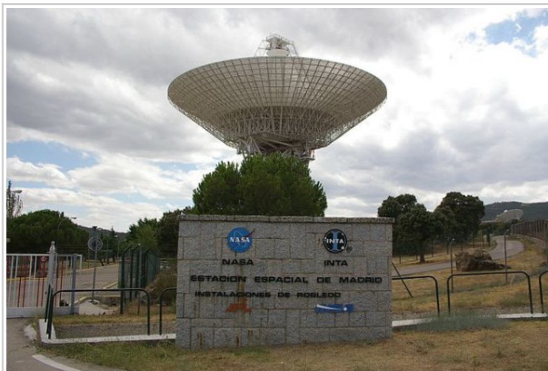
70metrová anténa sítě DSN umístěná ve Španělsku

Kromě výše zmíněné obousměrné komunikace nesmíme zapomínat ani na to, že antény sítě DSN mají i vědecké úkoly. V radiovém spektru zachytávají vlny odražené třeba od prolétávajících asteroidů. Kromě toho pomáhají zpřesňovat radiovou komunikaci měřením odchylek v šíření signálu a navíc ještě fungují jako obří interferometr.