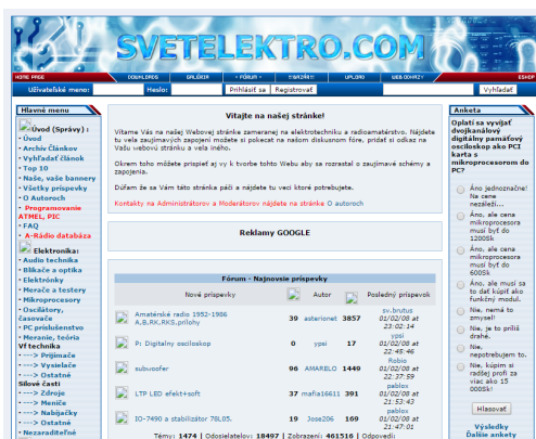
Prvý design stránky z roku 2006

Pribúdali nové články, užívatelia a začalo sa pomaly budovať fórum, ktoré je dnes neodmysliteľnou súčasťou stránky. Taktiež sa v priebehu vývoja menila aj samotná grafika webu. Zaspomínajme si spoločne: