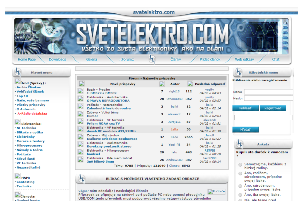
Prvá výraznejšia zmena designu stránky sa odohrala v roku 2010

Dnes ma stránka celkovo za sebou viac ako 10 miliónov návštev , pričom denne stránku navštívi viac ako 4000 unikátnych návštev . Bolo publikovaných 437 technických článkov , zaregistrovalo sa viac ako 17 tisíc užívateľov a na fóre sa napísalo viac ako pol milióna príspevkov vo viac ako 35 tisíc témach .